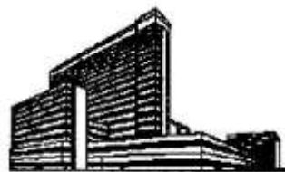
Hospital Central de la Defensa

GUÍA DE ACOGIDA DE LOS HOSPITALES UNIVERSITARIOS DE LA FACULTAD DE MEDICINA Y CIENCIAS DE LA SALUD UNIVERSIDAD DE ALCALA